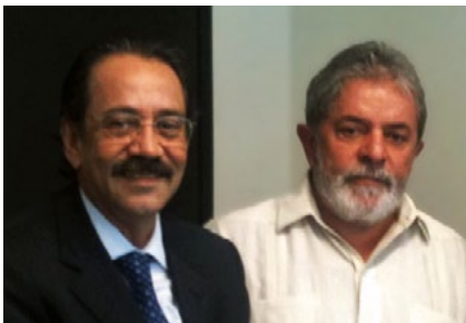
Rocha convida Lula para palestra

O SINAVAL convidou o ex-presidente Lula para a palestra que será realizada no dia 19 de setembro de 2011, em Niterói, sobre o tema “A Sustentabilidade da Indústria da Construção Naval Brasileira”.